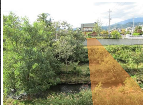
〈穴口側から室小路側を望む〉