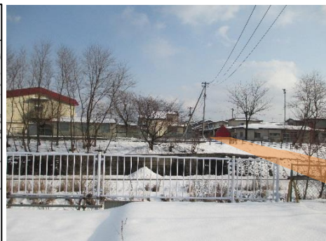
〈室小路側から穴口側を望む〉