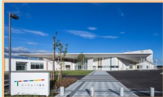
①交流拠点複合施設(施設全景)