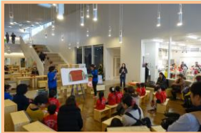
①交流拠点複合施設(ふれあい広場)