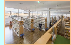
③交流拠点複合施設(図書館)