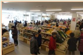
②産業創造センター(産地直売)