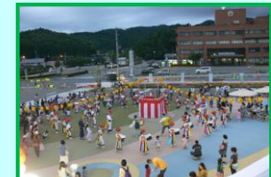
④広場(たきざわ広場)