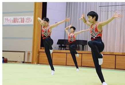
滝沢南中学校新体操