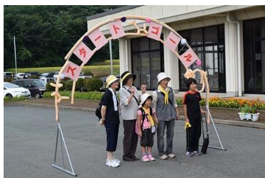
篠木ウォークラリー