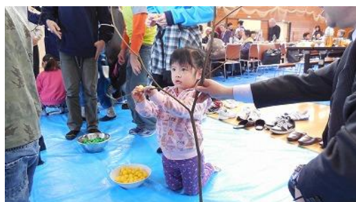
篠木冬まつり（ミズキ団子）