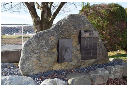
石川啄木の妻・節子の碑