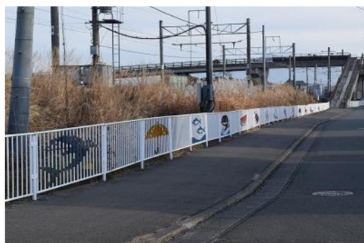
しりとりフェンス