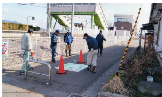
大釜駅とスマイルハート あいさつ運動事業