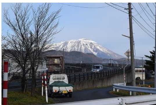
篠木跨線橋と岩手山